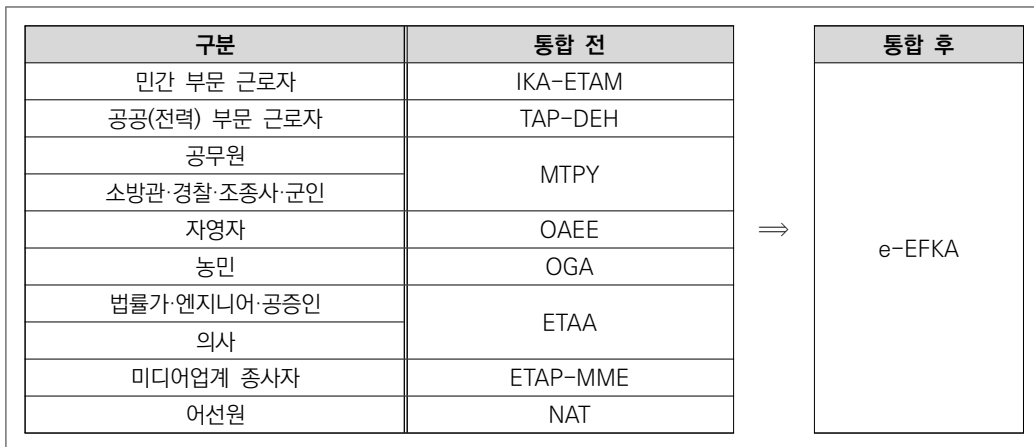
그림 4. 개혁 전후 공적연금 관리·운영 체계의 변화

자료: National Actuarial Authority of Greece. (2021). Greek Pension System Fiche . European Commission Economic Policy Committee Ageing Working Group. Ageing Projections Exercise 2021 자료를 바탕으로 저자 구성.