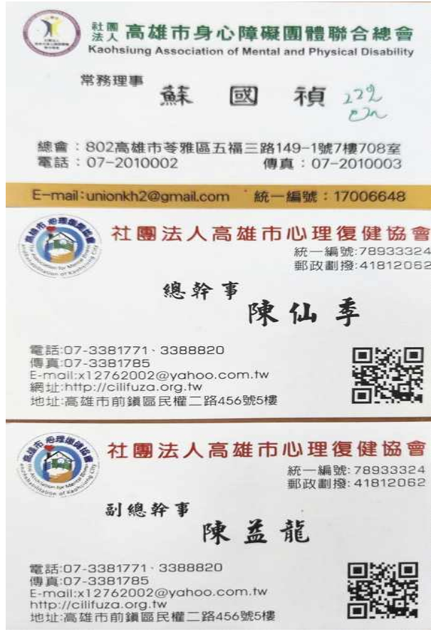
The Association for mental illness and Rehabilitation of kaohsiung City