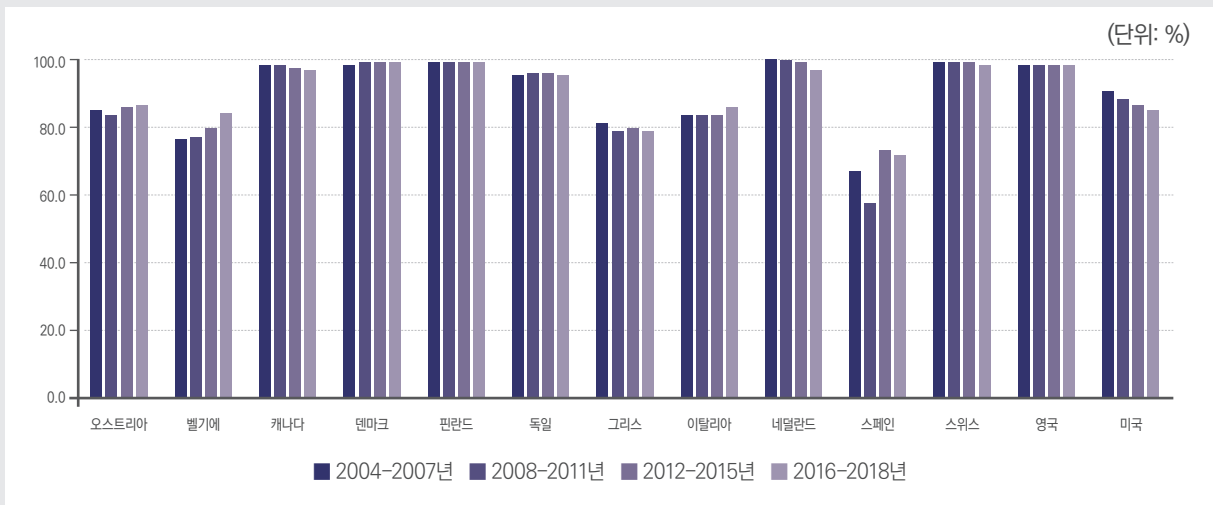
[그림 4] 2000년대 중반 이후 여성의 공적연금 수급률 추이